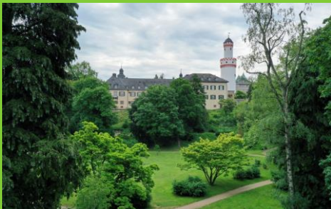
Schlosspark Bad Homburg

Zwei Stationen ( hier grün ) wurden nur in jeweils einem Lernort durchgeführt.